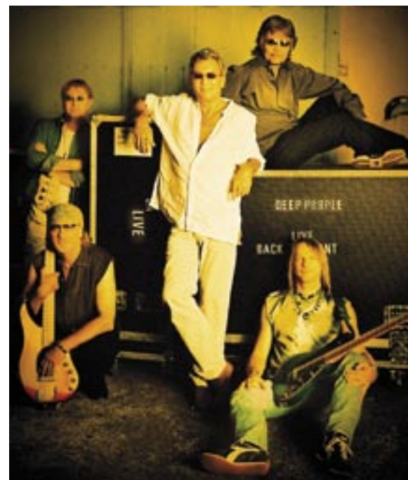
Dimanche 25 novembre

Ceux de Deep Purple passent le plus clair de leur temps sur la route, ce qui ne tarde pas à installer une certaine lassitude. A partir de 1979, clash et reformation se succèdent. Durant ces périodes, Gillian s'illustre au sein de Black Sabbath et le duo Ritchie Blackmore – Roger Glover fonde rien moins que Rainbow. Leur dernier opus où Don Airey assure les claviers s'intitule « Rapture of the Deep », ils y mêlent ballades étirées, débordements électriques sur un chant d'anthologie.